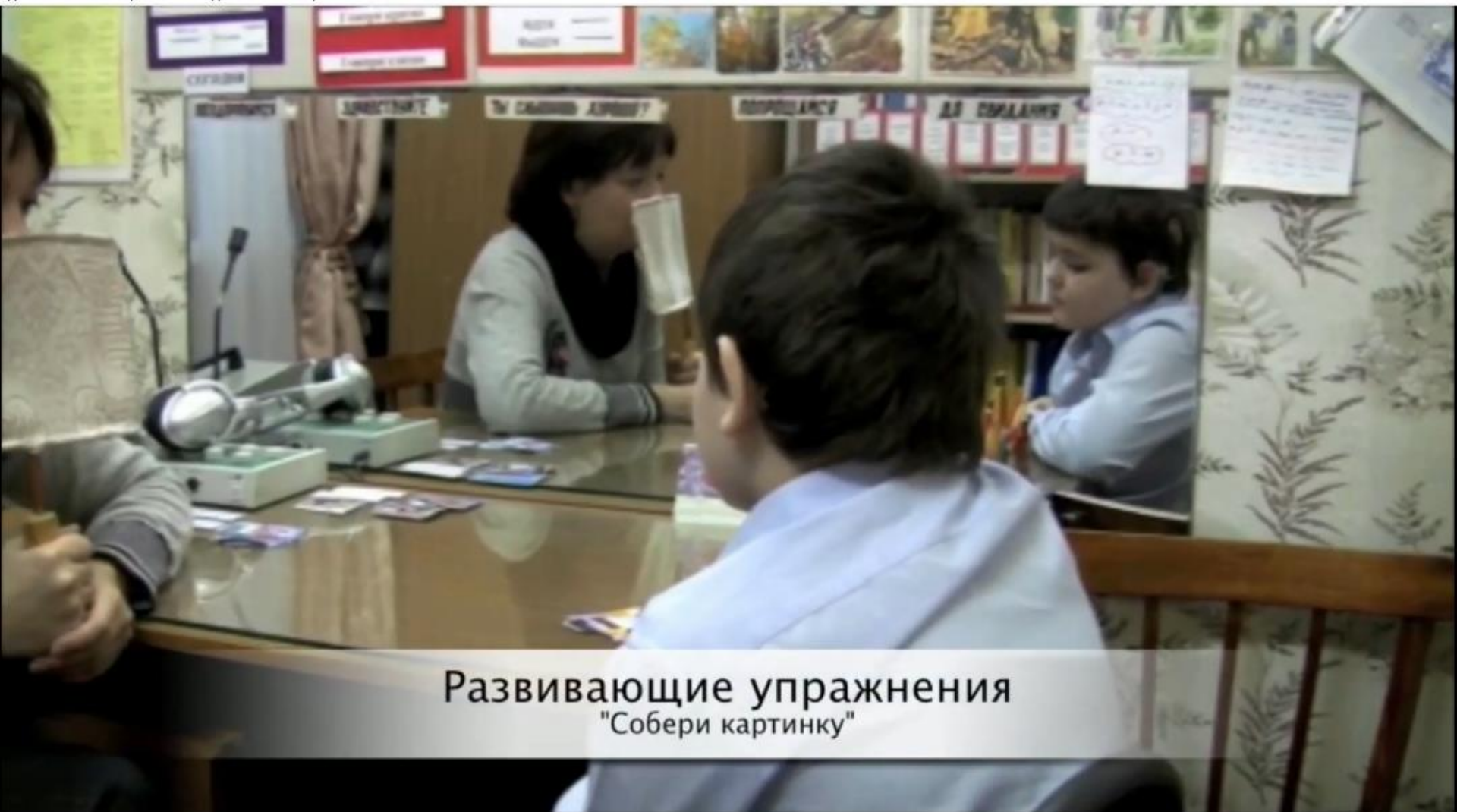
Развивающие упражнения "Собери картинку"