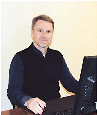
СВЯЩЕННЫЙ БОЙ (СВО)

Стихи и музыка представленной песни раскрывают суть моих мыслей и отношение к происходящему. Уверен, что эти строки будут понятны и родны для многих из вас!