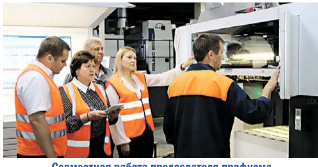
Совместная работа председателя профкома и специалиста по охране труда в цехе