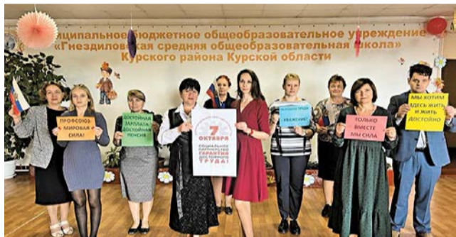
Профсоюз – наш защитник!