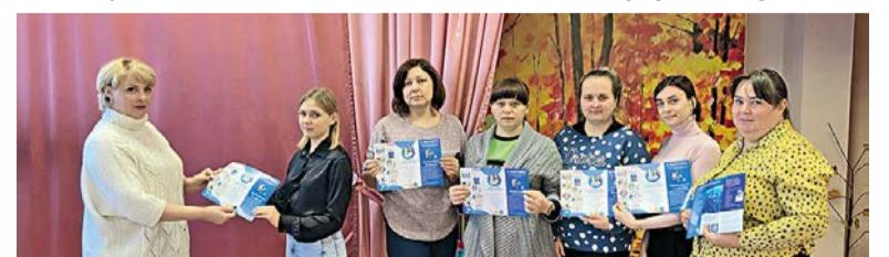
Интерактивное собрание для новых членов профсоюзов. МДОУ №130

Курская городская организация профсоюза образования