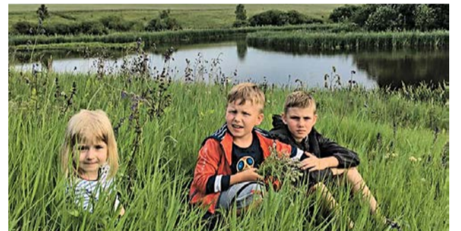
У сельского профсоюза есть будущее