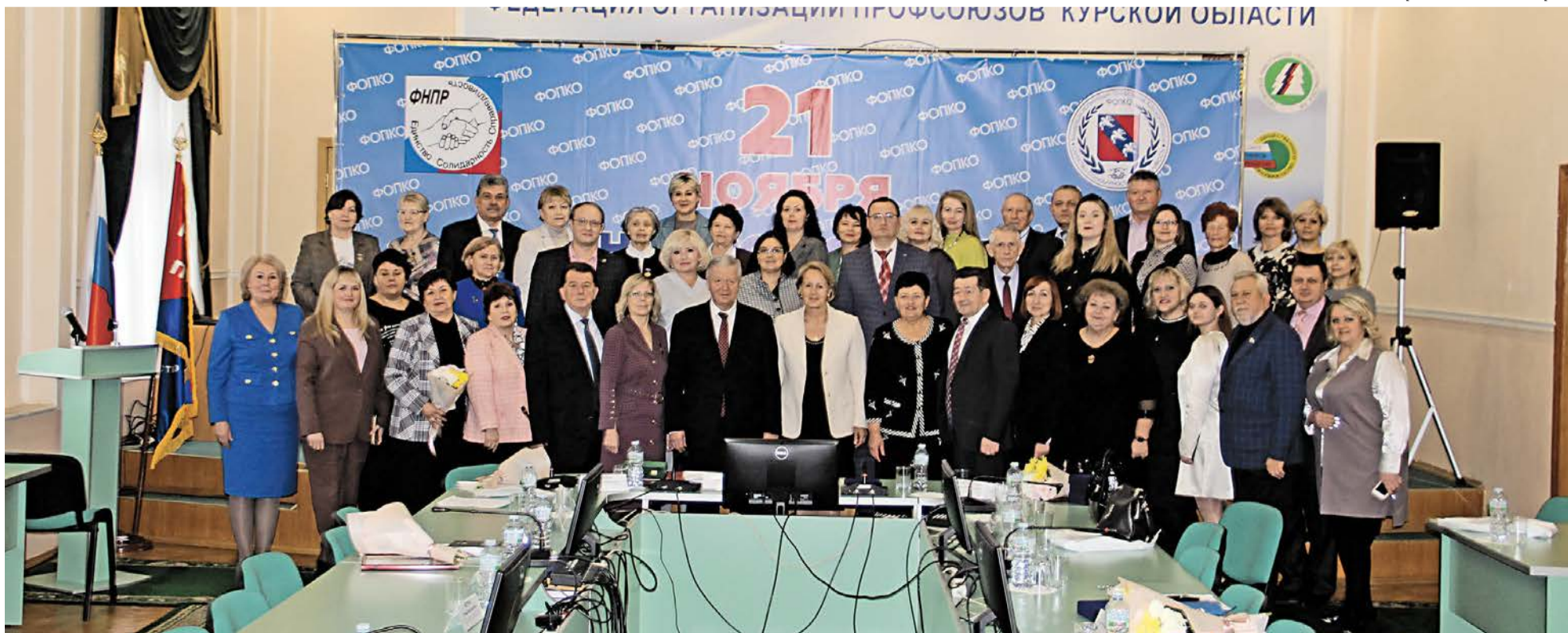
Участники торжественного заседания Совета Федерации организаций профсоюзов Курской области