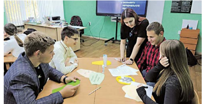
Подрастающему поколению о профсоюзе