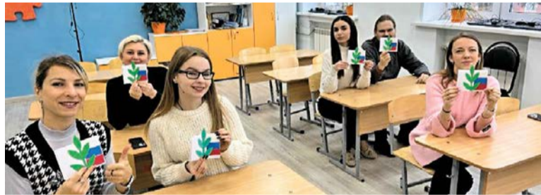
Изготовление открыток с профсоюзной символикой. Центр «Оберег» г. Курск

20 ноября стартовала профсоюзная неделя под девизом «с профсоюзом по жизни!», посвященная Дню профсоюзов в Курской области.