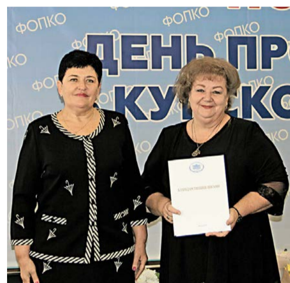
Деятельность областной организации профсоюза образования отмечена Благодарственным письмом депутата Государственной Думы