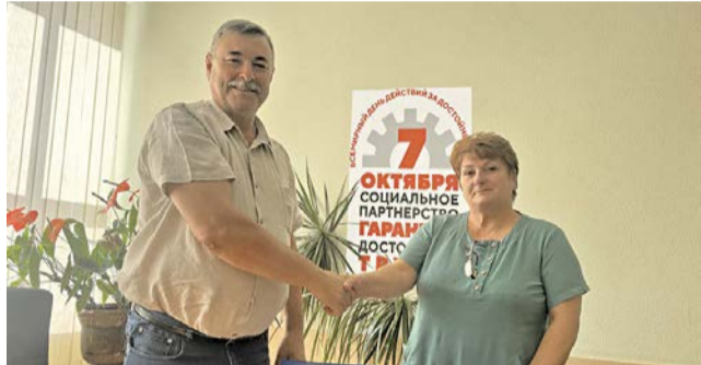
Коллективный договор подписан