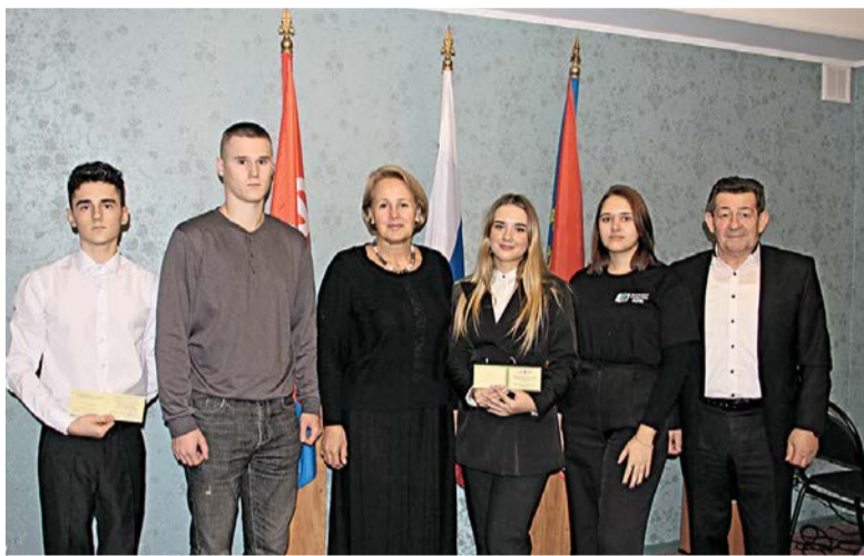
Стипендиаты – активисты студенческой профсоюзной жизни

Мероприятие проходило в рамках празднования Дня профсоюзов в Курской области и 105-летия профсоюзного движения.