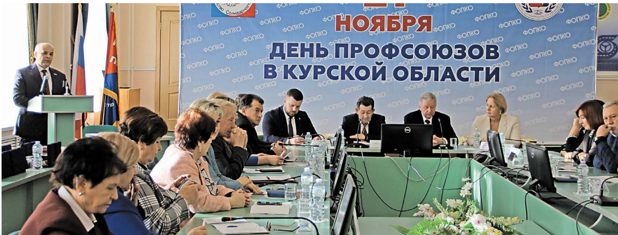
Профсоюзный актив региона поздравляет председатель Курской областной Думы Юрий Америк