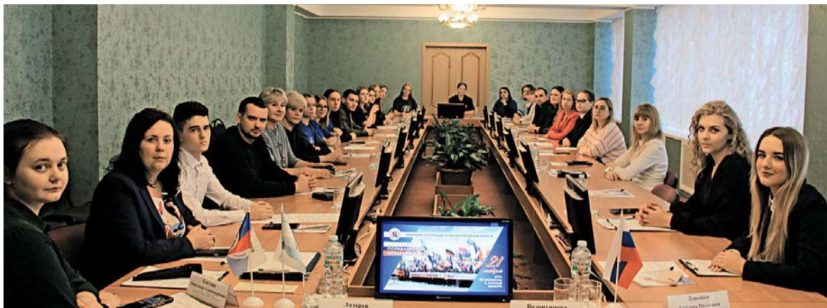
Участники расширенного заседания Молодежного совета