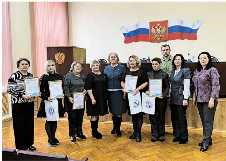
Организаторы акции и актив Поныровского района