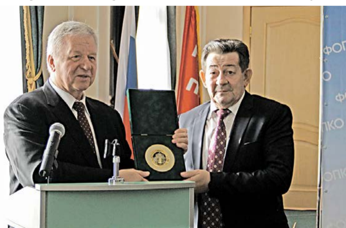
Работа Курских профсоюзов отмечена как лучших в ЦФО